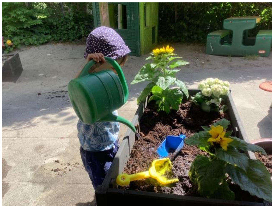
Så skal der vandes, børnene er gode til at vande alle vores fine planter, som de har plantet med forældrene på blomsterdag.