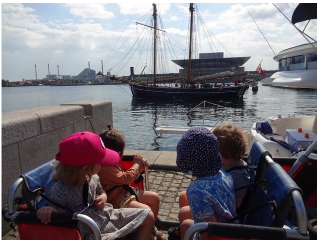
På tur til Amalienborg, hvor også de flotte skibe nydes.