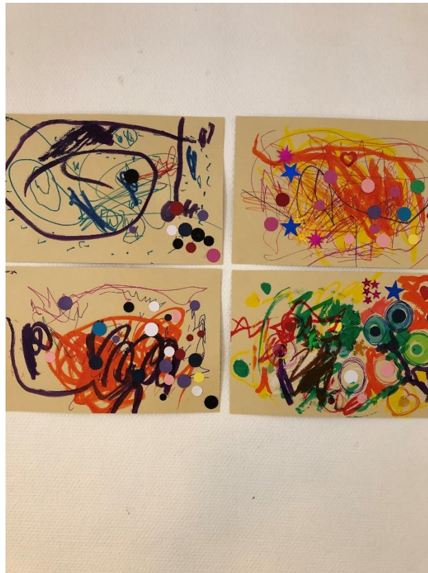
Børnenes kunst pynter væggene i Platangården.

I Platangården har vi indrettet inspirerende og kreativt miljøer, med plads til fordybelse. Vi har indrette stuer, gang og legeplads, så det er muligt at fordybe sig i mindre grupper. Der kan skabes inspirerende og kreative læringsmiljøer både inde og ude. Vi gør meget ud af at udsmykke Platangården med børnene egne værker. Vi har meget fokus på at børnene kan veksle mellem store og små fællesskaber. Der er tid til fordybelse, nærhed, leg og læring. Der er en god blanding af legetøj og udstyr der gør det muligt at have forskellige lege samt løse opgaver og udforske.