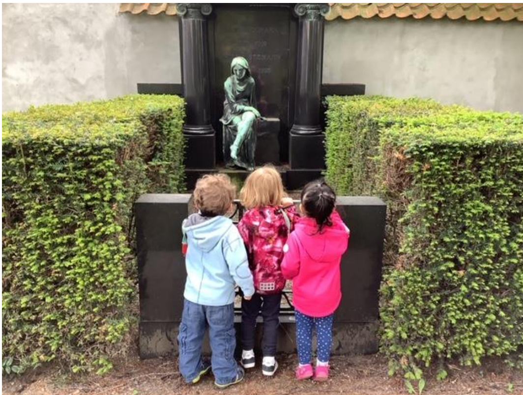
Turen går til Frederiksberg kirkegård og kigge på flotte skulpturer