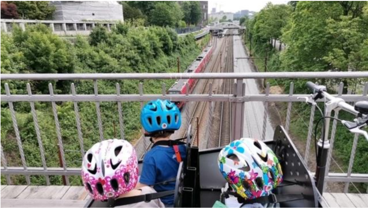
På cykeltur i nærmiljøet