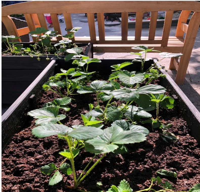
Vores hjemmedyrkede jordbær som vi passer og plejer i løbet af sommeren