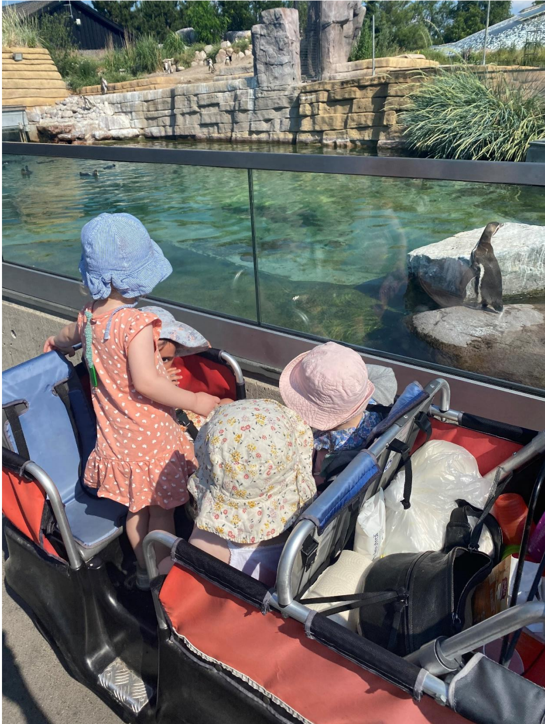
På tur i Zoologiskhave