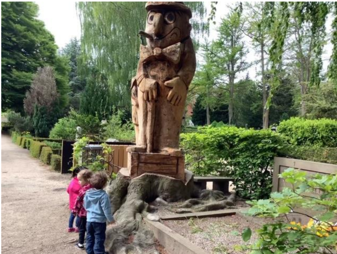
Vi nyder at finde flotte skulpturer rundt omkring i nærmiljøet

I Platangården er vi opmærksomme på at vi i vores arbejde er kulturbærer, rollemodel og formidler af kulturelle udtryksformer og værdier. Samtidig med, at en af de vigtigste grundsten i vores pædagogiske arbejde er at anerkende børns leg, som en kulturel og skabende proces. Det er vigtigt at børnene oplever det, at skabe kulturelle udtryk som værende sjovt. Vi mener at processen er vigtigere end produktet. Vi arbejder på at få organiseret aktiviteter der tager udgangspunkt i det enkelte barn og gruppen som helhed.