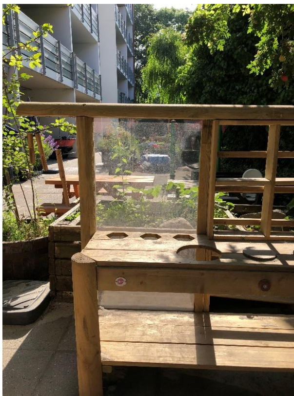
Et lille læringsmiljø med plads til fordybelse.

Der er opsat spejle i børnehøjde og billeder af kroppen. Hver stue har en montre til udstilling hvor der løbende bliver udskiftet alt efter hvad der er i fokus på stuerne. Stuerne og gangarealerne er udsmykket med børnene egne kreativiteter. På gange og stue er der diverse motoriske legeredskaber såsom bobles, køretøjer, dukkevogne og gå vogne samt madrasser og puder. Rundt omkring i Platangården er der opsat vægmoduler til styrkelse af finmotorik.